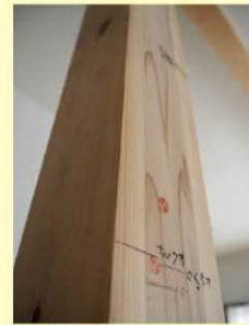
※県内で撮影されたものに限ります。