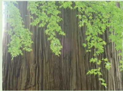
※県内で撮影されたものに限ります。

宮崎県は、県土のおよそ76%を森林が占め、30年連続でスギの素材生産量が日本一となるなど、日本有数の森林・林業県として、県内各地に豊かで美しい森林があります。そんな森林が創り出す風景等を募集します。