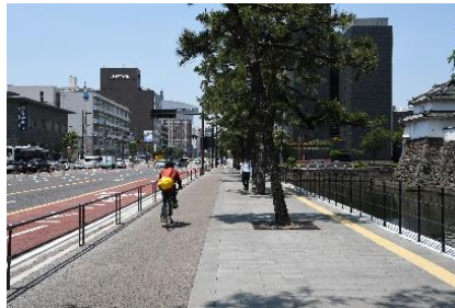
歩道拡張されたクロマツ区間

本通りは舗装や歩道橋等の劣化が問題視され、四隅にある小広場は鬱蒼とした植栽が林立し、人の活動は皆無であった。これを受け、通行者が利用できるロングベンチを四隅に配備したり、雑然としていた低木植栽を撤去し、自転車道を新設するなど、交差点一体をひとまとまりの空間として再生させている。