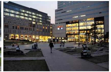
周辺ビルへの波及効果が確認