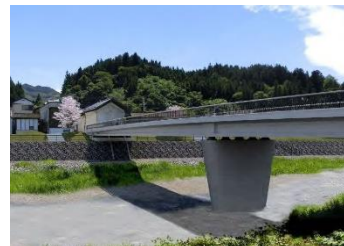
岩手県住田町昭和橋設計