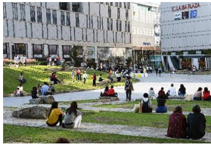
賑わいを取り戻した警固公園

警固公園はかつて死角の多さから夜間の犯罪や騒音被害等が相次いでいた。これを受け、本事業では単に見通しを良くする防犯対策のみならず、周囲の景観や賑わいを考慮したデザイン提案がなされ、その結果、治安改善とともに人通りの増加、園内における利用者動線の広がり等に繋がった。