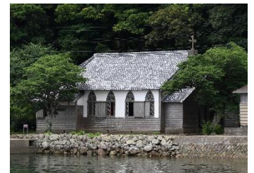
長崎県五島市景観整備

美しい宮崎づくり推進室ではFacebook及びYouTubeチャンネルを開設しています！活動団体の取り組みやイベント情報などを掲載していますのでぜひご覧ください！