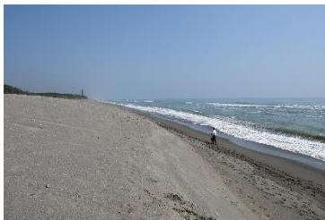
宮崎海岸侵食対策事業