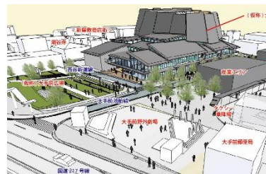
大分県佐伯市大手前地区開発