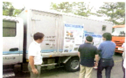
【屋外実演】スケルカ説明