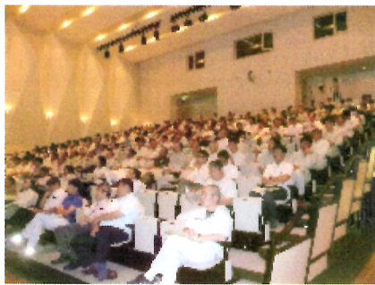
【会場内】特別講義、工法説明、事例紹介