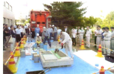
【屋外実演】模擬床版を用いた断面復旧