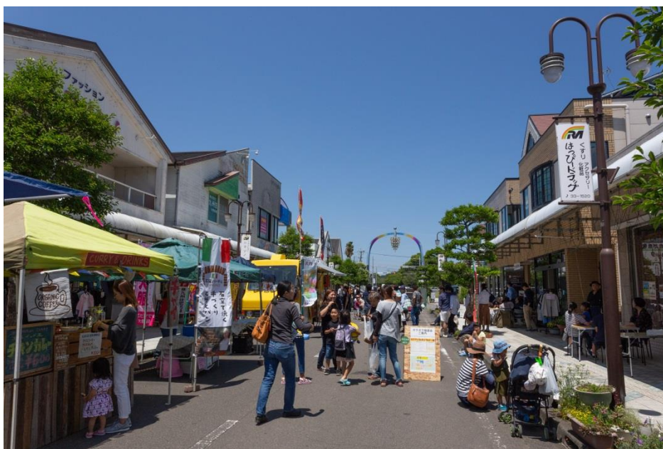
毎月開催されているこゆ朝市