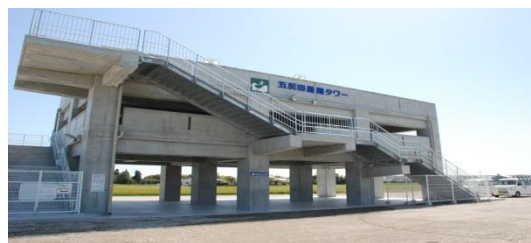
完成した津波タワー