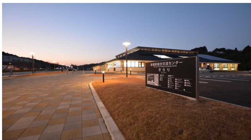
総合交流センターきらり