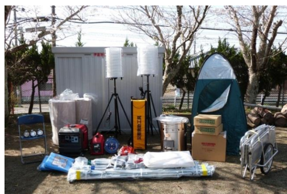
自主防災組織に配備された防災資機材