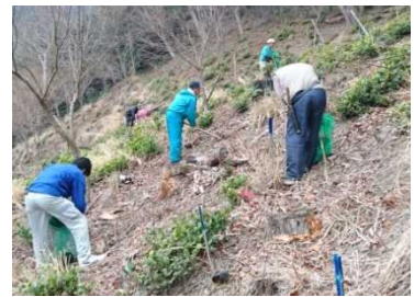
花見山 植え付け作業の様子