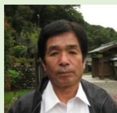
小川作小屋村運営協議会 会長