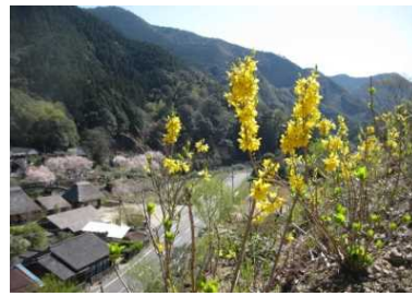
季節の花が楽しめる小川作小屋村

おがわ作小屋村発足以来運営に従事し、2013年5月小川作小屋村運営協議会会長に就任。協議会では、花見山ともみじ山の造成、お客さまに提供する山菜などの栽培、おもてなしについて特に力を注いでいる。