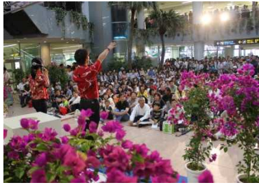
ブーゲンビリアプレゼント抽選会の様子