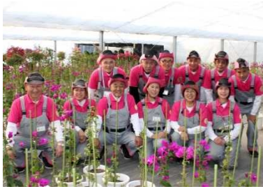
宮崎空港ビル グリーンキーパーのみなさん