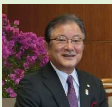
宮崎空港ビル(株) 取締役社長